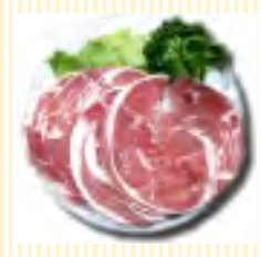
ラムジンギスカン (100g)