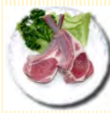
ラム骨付きロース(2本)