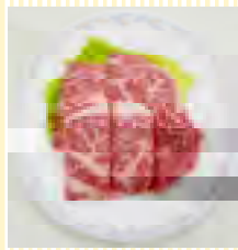
黒牛(交雑種)ロース (100g)