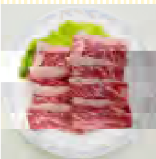
黒牛(交雑種)カルビ (100g)