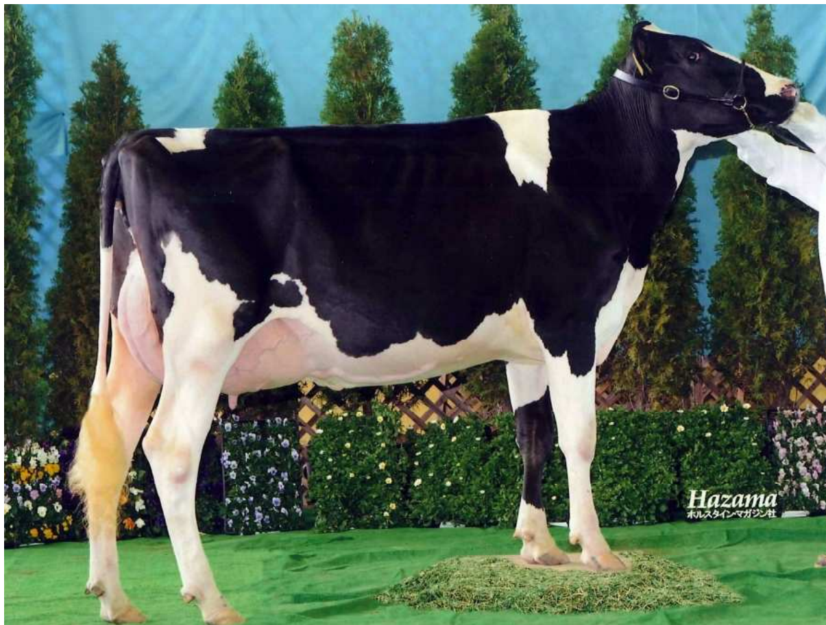
平成24年11月23日静岡県御殿場市馬術・スポーツセンターにおいて

くずまき高原牧場で育成された当社展示搾乳牧場牛が、第8回全日本ブラックアンドホワイトショーにおいて第7部1位を受賞しました。